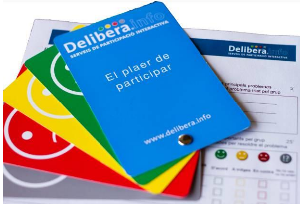
Ilustración 1. Sistema de herramientas deliberativas