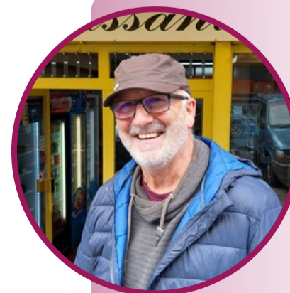
CROISSANTERIE Patxi Lasa - Bezeroa ANDRA MARI

Euskara erabiltzearen hautua, gure denda bera bezala, familiaratik datorkigu. Betidanik eskaini dugu zerbitzua euskaraz eta gero eta bezero gehiago euskaraz zuzentzen zaizkigu orain, erosotasunez.