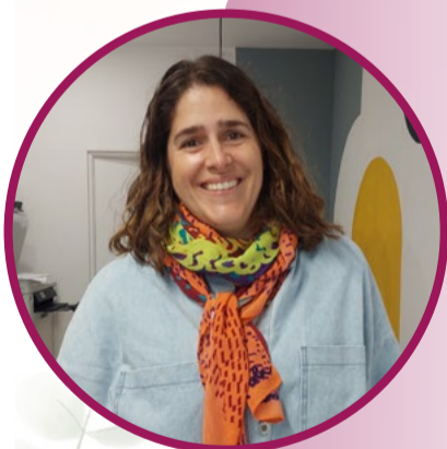
AKOTA ESTUDIOA Zuriñe Unzueta - Arkitektoa ROMO

Informazio gehiago nahi nahi baduzu, jar zaitez harremanetan 688 655 112 edo gehi@getxo.eus