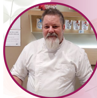
ZURIKALDAI Kimetz Garate - Okina NEGURI

Tortilla-pintxoak euskaraz eskatu, eta gustura ordaintzen dut. Pintxorik goxoenak, euskaraz eskatzen duguna!