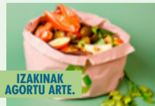
IZAKINAK AGORTU ARTE.

OSTIRALA 5. OLIBA-OLIO EKOLOGIKOAREKIN XABOIA EGITEKO TAILERRA. 12:00etatik 14:00etara - GETXO ELKARTEGIA. Egin artisau-xaboia oliba-olio ekologikoa erabilia eta ikasi kontsumo-ohitura jasagarriak..