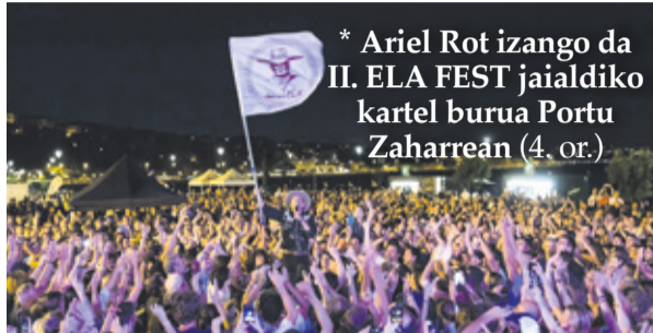
* Ariel Rot izango da II. ELA FEST jaialdiko kartel burua Portu Zaharrean (4. or.)

Odol-emateak. Hilaren 17an, astelehena, eta hilak 20, osteguna, Algortako eta Areetako Geltokia plazetan, hurrenez hurren. Goizez eta arratsaldez.