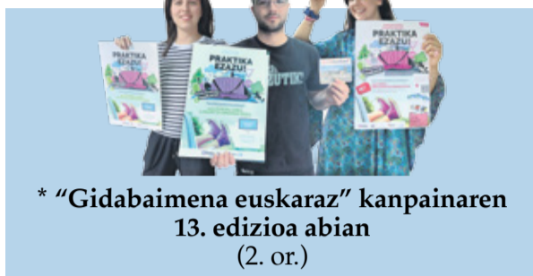
* "Gidabaimena euskaraz" kanpainaren 13. edizioa abian (2. or.)