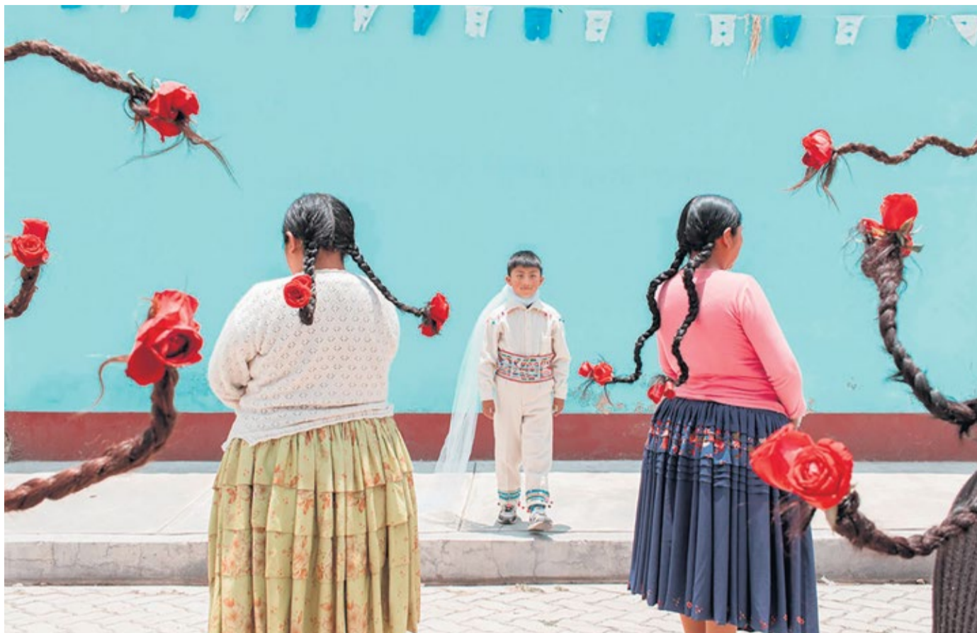
River Claire, Wararwar wawa