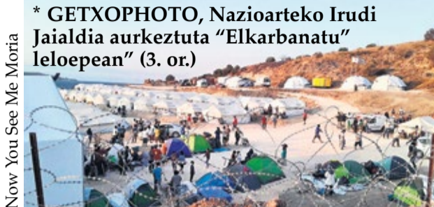
Now You See Me Moria

Antzerkia. Hilak 24, larunbata, 19:00etan, Muxikebarrin, "Desfasando, que es gerundio", Lalulu Teatrotan. Sarrera: 12€.