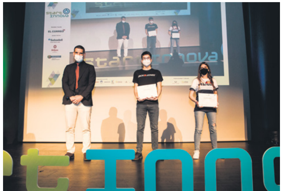
18 urtez azpikoen mailako hirugarren saria Julio Caro Baroja Institutuko ikasleek irabazi zuten