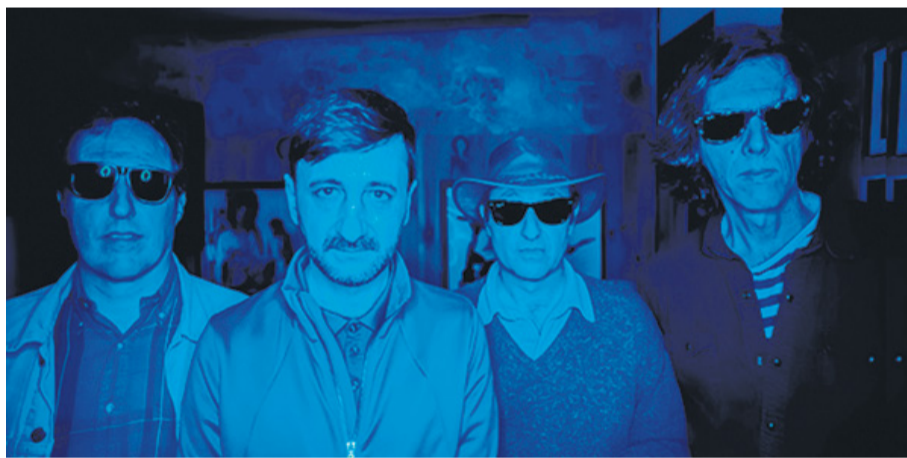
El Inquilino Comunista

Producido por el propio Lafita y Luis Echevarría, "Dale CandELA The Soundtrack" verá la luz en verano y estará compuesto por 18 temas originales, compuestos y escritos para la ocasión e interpretados, entre otros, por formaciones como "McEnroe", "Smile", "El Inquilino Comunista", "Los Brazos", "The Fakeband", "Still River", "Last Fair Deal", "Lee Perk", "Margo Cilker", "Nebraska", "Los Retros", "The Hornies", "Keep Calm", "The MarshALS", "Ontario", "Peter & Velas", "Amigos de DalecandELA" y "Tresonrock". Cada grupo pondrá su firma a la causa con letra y música con la finalidad de visibilizar la ELA desde una apariencia entusiasta. "La música estará inspirada en el afán de superación, la lucha ante la adversidad, la esperanza y la amistad. Un mensaje de positividad y optimismo con una clara preferencia: la de saborear la vida, pase lo que pase", dicen desde la organización.