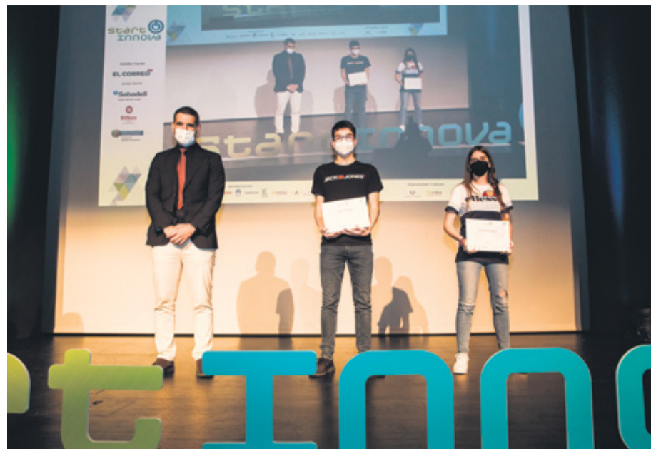
El tercer premio en la categoría -18 se lo llevó alumnado del Instituto Julio Caro Baroja