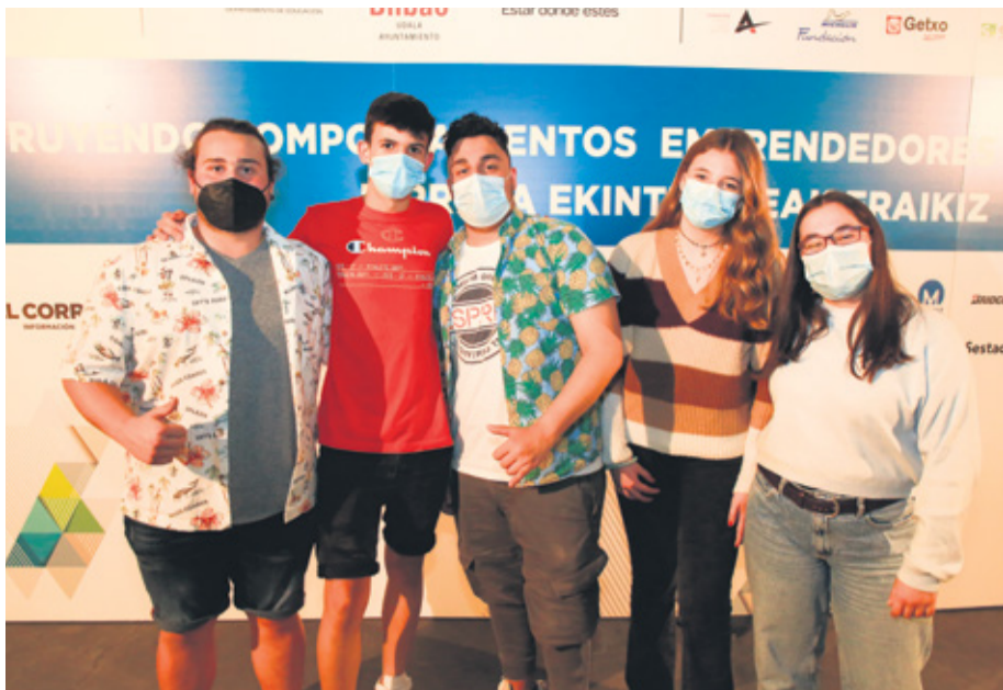
Estudiantes del colegio Azkorri, que se hicieron con el primer premio de menores de 18 años