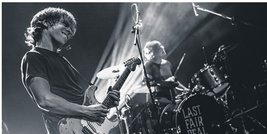
Last Fair Deal