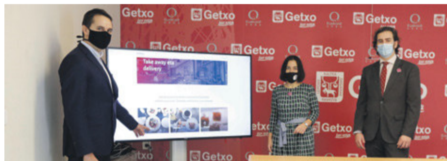
Alkatea, EAJ/PNV eta PSE-EE alderdietako gobernu taldeko kideekin batera

Ostalaritzara eta jatetxeen sektorerako bideratutako laguntza sorta berriak 82.000 euroko inbertsioa ekarriko du. Zerga-arloan, 2020. urteari dagokionez, Udalak espazio publikoa okupatzeagatik tasaren zati proportzionala itzuliko die ostalariei