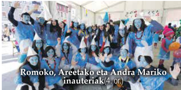
Romoko, Areetako eta Andra Mariko inauteriak (4. or.)

Opera. Matxoak 6, ostirala, 19:00etan, Muxikebarrin (Ereaga aretoan), Don Giovanni (Mozart), Compañía Lírica ópera 2001 elkartearekin. Sarrera: 40€.