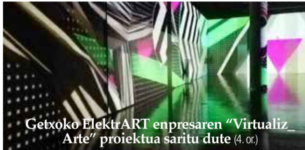
Getxoko ElektrART enpresaren "VirtualizArte" proiektua saritu dute (4. or.)

Inauteriak. Otsailak 21, ostirala, 10:30etik aurrera, Eskola inauteriak. Hilak 22, larunbata, Romoko eta Areetako inauteriak, eta hilak 23, igandea, Andra Marin.