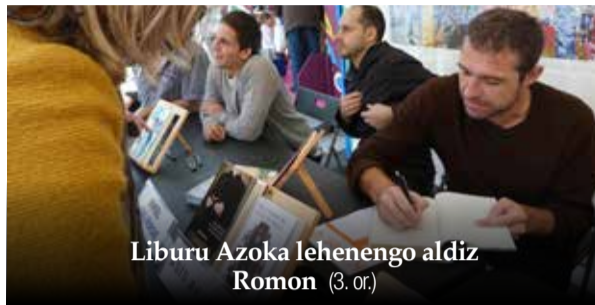
Liburu Azoka lehenengo aldiz Romon (3. or.)