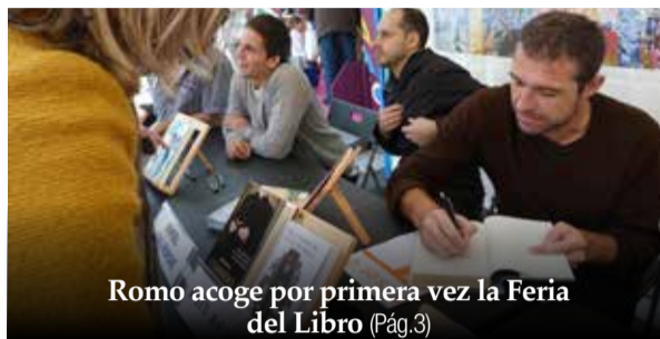
Romo acoge por primera vez la Feria del Libro (Pág.3)