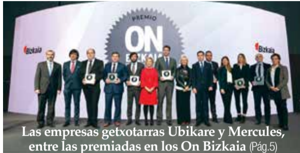
Las empresas getxotarras Ubikare y Mercules, entre las premiadas en los On Bizkaia (Pág.5)