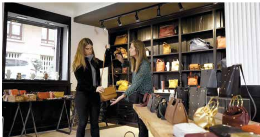
La tienda de Mercules en Neguri

Beaz, han desarrollado un software que permite diseñar un plan específico de salud física, mental y emocional, supervisado por profesionales, y que