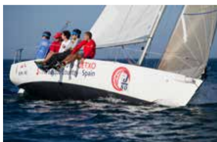
foto-galería y una video-galería de la clase J 80, así como todo lo que mencionan las redes sociales a tiempo real. Además, a través de su oficina técnica virtual, permite realizar las inscripciones al Campeonato de una forma muy ágil e intuitiva. En este site también se ofrece todo tipo de información de interés para las personas que vayan a visitar el Club con motivo del evento.

El Club Marítimo del Abra-R.S.C. ha dado a conocer la página web oficial del Campeonato del Mundo de la clase J 80, que se celebrará en aguas del Abra del 13 al 20 de julio de 2019: www.j80worlds2019.com . En ella, armadores, regatistas participantes, técnicos/as, personas aficionadas a la vela, medios de comunicación... encontrarán toda la información relativa a este evento.