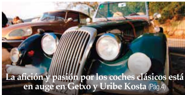
La afición y pasión por los coches clásicos está en auge en Getxo y Uribe Kosta (Pág.4)