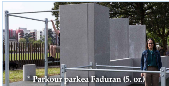
* Parkour parkea Faduran (5. or.)

Antzerkia. Maiatzak 8, ostirala, 20:00etan Muxikebarrin, "El barbero de Picasso", Antonio Molero eta Pepe Viyuelarekin. 18 euro.