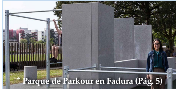
Parque de Parkour en Fadura (Pág. 5)

Teatro. Viernes 8, a las 20:00 h, en Muxikebarri, "El barbero de Picasso", con Antonio Molero y Pepe Viyuela. 18 €.