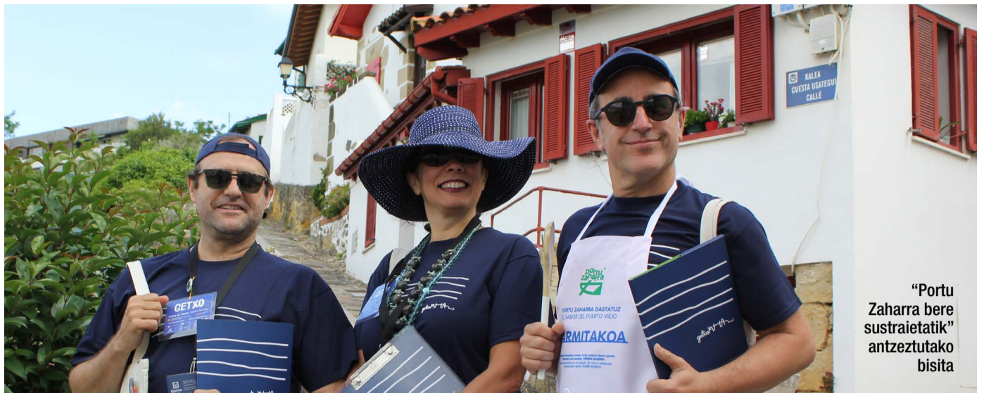
“Portu Zaharra bere sustraietatik” antzeztutako bisita

*Bisita geologikoa, Naturgaua. Gaueko abentura familian. Apirilaren 3an, (ostirala) 22:00etatik 00:00etara. Prezioa: 15 euro.