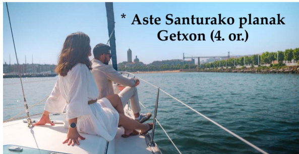
* Aste Santurako planak Getxon (4. or.)

Haur-zinemako campusa Aste Santuan. Apirilaren 7tik 10era, Romo Kultur Etxean.