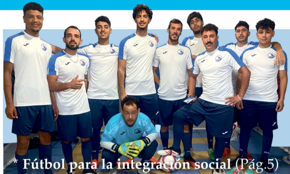
Fútbol para la integración social (Pág.5)

Teatro. Sábado 24, a las 20:00 h, en Muxikebarri, "La mujer rota", con Anabel Alonso. 12 €.