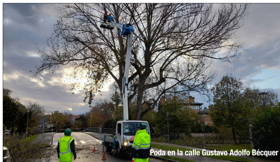
Poda en la calle Gustavo Adolfo Bécquer

En total, se prevé podar más de 4.600 ejemplares, alternando los descansos en las zonas en las que la poda se practicó el pasado ejercicio. Se trata de evitar podas anuales en especies que no lo precisen a los efectos de tratar de mejorar su estado estructural siempre que sea posible.