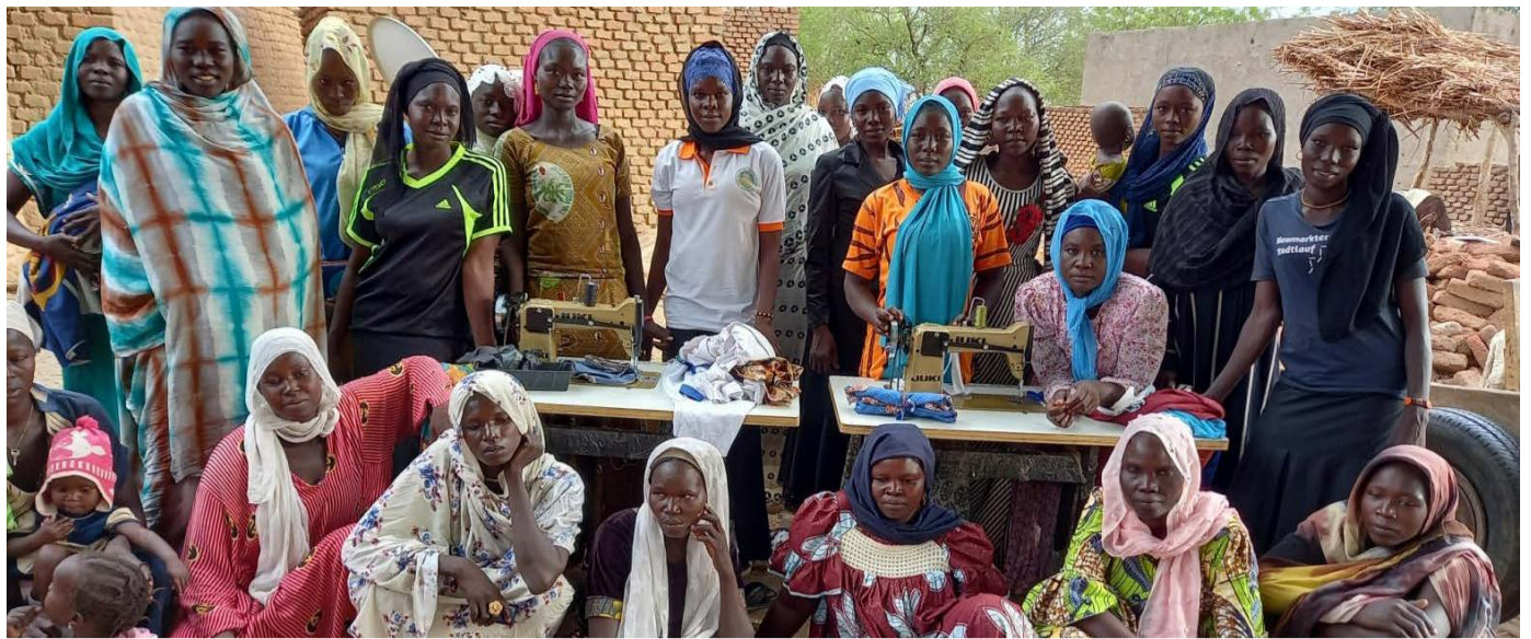
Moukoulou elkarte (Txad)

Bestalde, 37.800 euro izango dira ATFAL elkartearentzat, Tindufeko kanpalekuan dauden saharar errefuxiatuen elikadura bermatzen laguntzeko, ezgaitasunen bat duten pertsonen bizi-kalitatea hobetzeko beren birgizartratzea sustatuz, 5 haurren osasuna hobetzeko, eta udan familia getxotarrekin haurren harrera eta kultura-trukea indartzeko Oporrak Bakean-Vacaciones en Paz izeneko ekimenaren bidez.