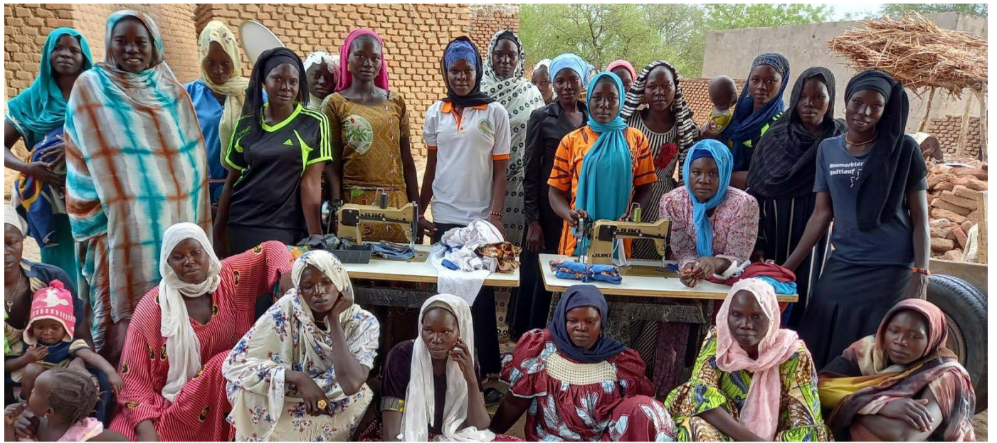
Asociación Moukoulou (Chad)

Por otra parte, 37.800 € serán para ATFAL, a fin de colaborar en garantizar la alimentación de la población refugiada saharauí en los campamentos de Tinduf, mejorar la calidad de vida de la población discapacitada facilitando su integración y la salud de 5 menores saharauís, a la vez que para impulsar el acogimiento de menores en familias getxotarras durante los meses de verano e impulsar el intercambio cultural a través de la iniciativa "Oporrak Bakean-Vacaciones en Paz".