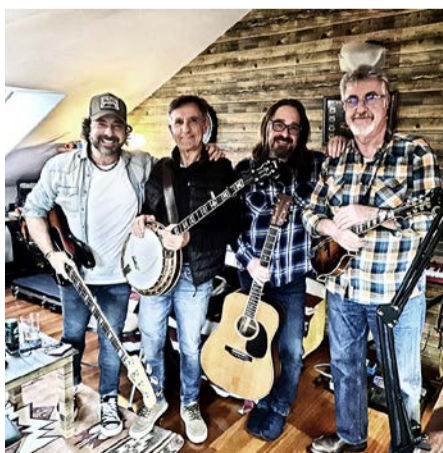
West Bluegrass Band, 2025-2026an aukeratutako proiektua

Aurreko edizioan bezala, deialdia hiru modalitatetan antolatuko da. Lehenengoa sektoreko