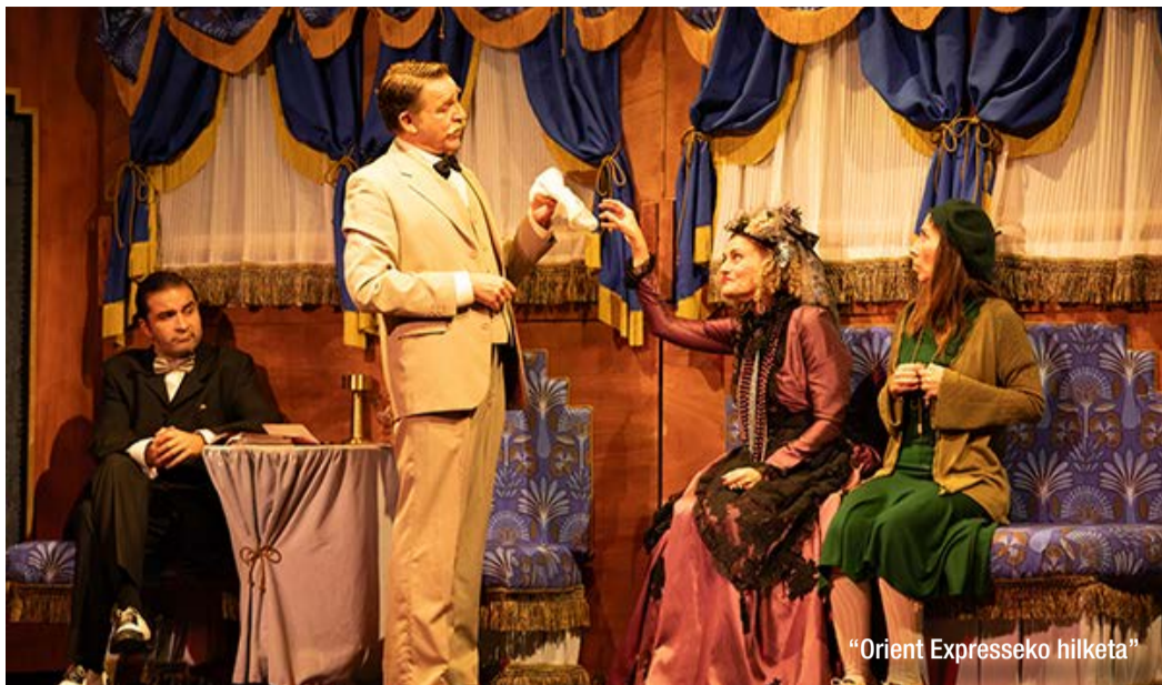
"Orient Expresseko hilketak"