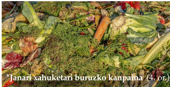
*Janari xahuketari buruzko kanpaina (4. or.)

Umorezko ikuskizuna. Hilak 11, ostirala, 20:00etan, Muxikebarrin, "Nahastumbury" (euskaraz), Barretxerkarekin. 8€.