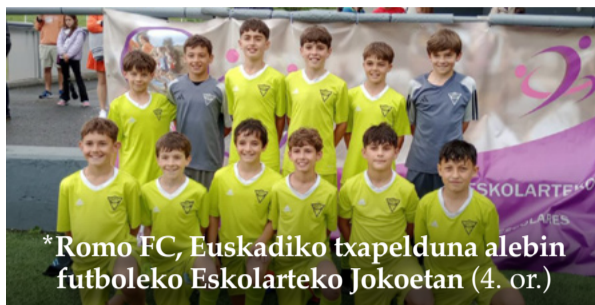
*Romo FC, Euskadiko txapelduna alebin futboleko Eskolarteko Jokoetan (4. or.)

VII. Getxo Kantari Eguna. Hilak 14, larunbata, 12:00etan, San Nikolasetik abiatuta, kantu jira Algortan. 15:30ean herri bazkaria San Nikolaseko frontoian.