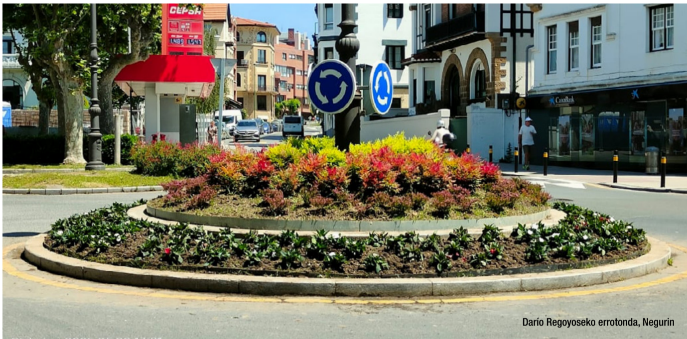
Darío Regoyoseko errotonda, Negurin