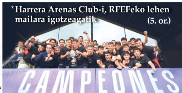
*Harrera Arenas Club-i, RFEFeko lehen mailara igotzeagatik (5. or.)

Kontzertua. Hilak 16 (ostirala), 21:00etan, Muxikebarrin, Euskoprincess. 5€.