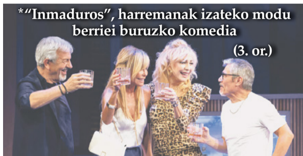
*"Inmaduros", harremanak izateko modu berriei buruzko komedia (3. or.)