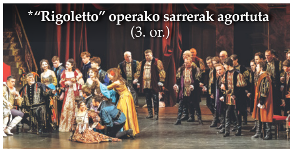
*"Rigoletto" operako sarrerak agortuta (3. or.)