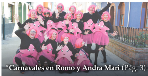
*Carnavales en Romo y Andra Mari (Pág. 3)

Concierto. Viernes 7 de marzo, a las 21:00h, en Muxikebarri, "Eire & J Martina". 12€.