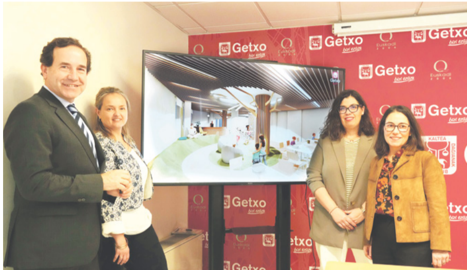
Jarduera udal Gobernuak (EAJ/PNV eta PSE-EE) eta PPEk lortutako aurrekontu akordioaren emaitza da