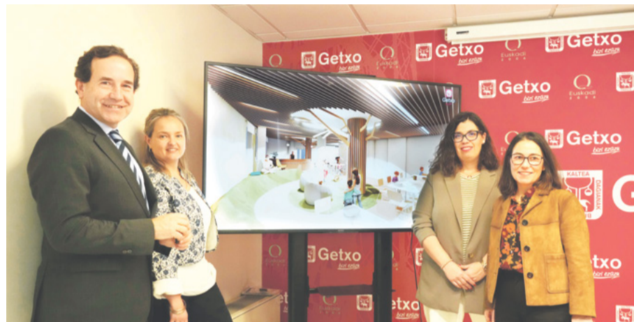
La actuación es fruto del acuerdo presupuestario alcanzado por el Gobierno municipal (EAJ/PNV y PSE-EE) y el PP