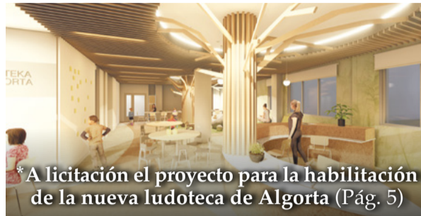
A licitación el proyecto para la habilitación de la nueva ludoteca de Algorta (Pág. 5)

Danza. Sábado 1 de marzo, a las 20:00h, en Muxikebarri, "Firmamento", con La Veronal. 25€.