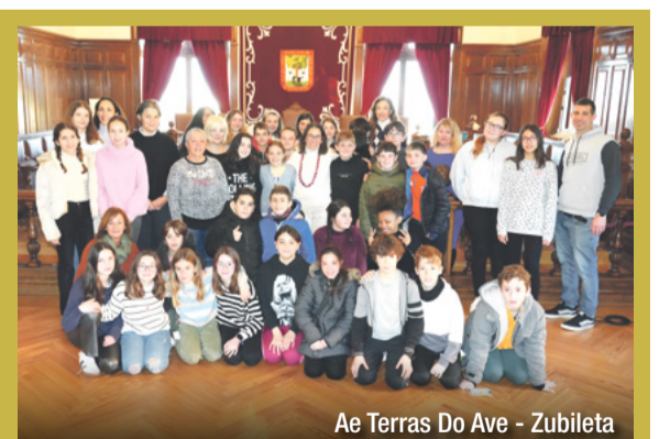
Ae Terras Do Ave - Zubileta