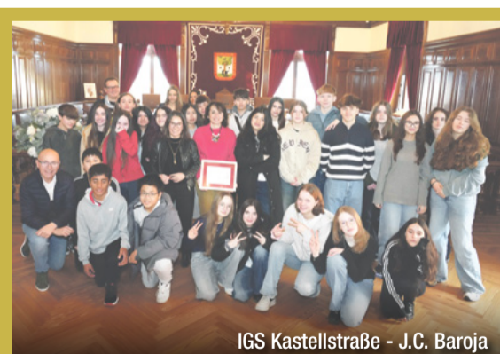
IGS Kastellstraße - J.C. Baroja

Las personas que se acerquen a la calle Máximo Aguirre, en el barrio de Santa Ana, verán en cada uno de los árboles existentes en la misma un número que indica el porcentaje de pudrición (de 0 a 100) de los ejemplares que están afectados por el efecto de dos hongos: Ganoderma adspersum e Irpex laceratus . Una vez tratados los suelos para eliminar la presencia de estos hongos, los árboles serán sustituidos por nuevos ejemplares de tilo, dentro de la actuación que se está llevando a cabo para la creación de un Boulevard verde en dicha calle.