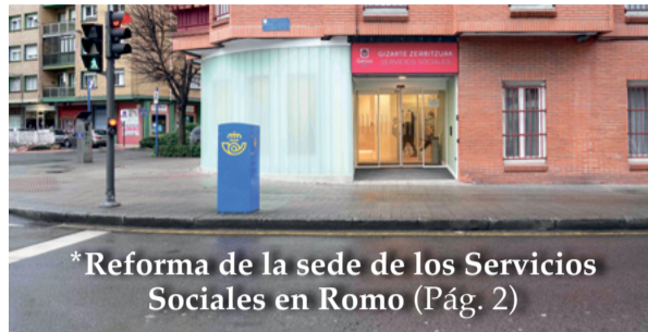
*Reforma de la sede de los Servicios Sociales en Romo (Pág. 2)

I Festival Getxo Live. Del viernes 21 al domingo 23, en Muxikebarri, conciertos de 9 grupos locales, para todas las edades. 5€ (abono 12€).