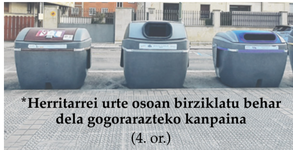
*Herritarrei urte osoan birziklatu behar dela gogorarazteko kanpaina (4. or.)

Antzerkia. Otsailak 1, larunbata, 20:00etan, Muxikebarrin, "La colección", José Sacristánekin. 20€.