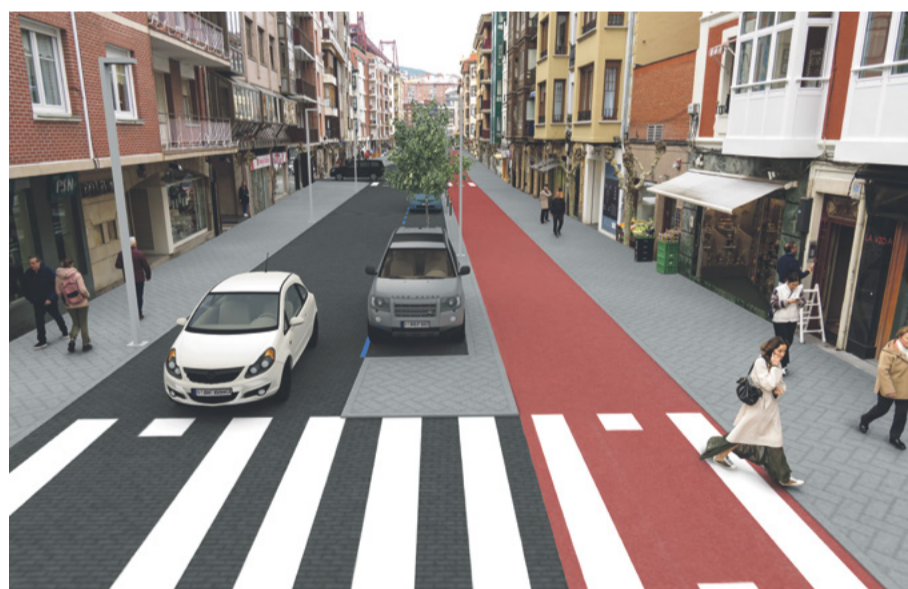
Mayor kalea, Santa Anarekin bat egiten duen tokian, Bizkaia Zubirantz