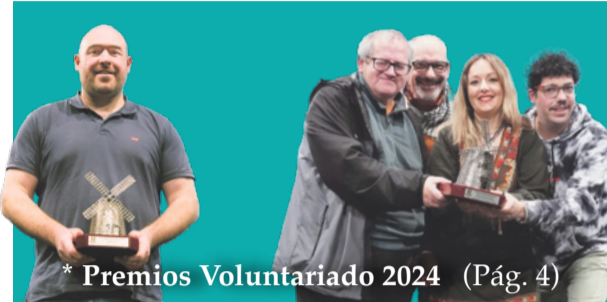
* Premios Voluntariado 2024 (Pág. 4)

Getxolandia-Parque Infantil de Navidad. Del 20 de diciembre al 6 de enero, en la plaza de la Estación de Las Arenas.