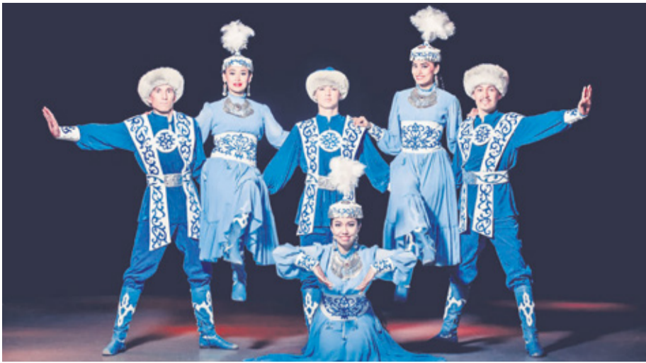
El grupo Naz, de Kazajstán, abarca cantos y bailes en armonía con la tradición y valores humanos milenarios