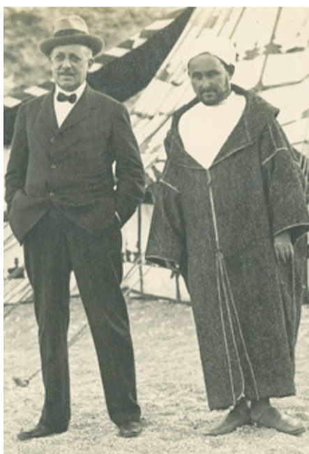
Echevarrieta junto al líder rifeño Abd-El-Krim, con quien negoció la liberación de los prisioneros caídos en el Desastre de Annual

Echevarrieta nació en Bilbao en 1870, pero hizo de Punta Begoña