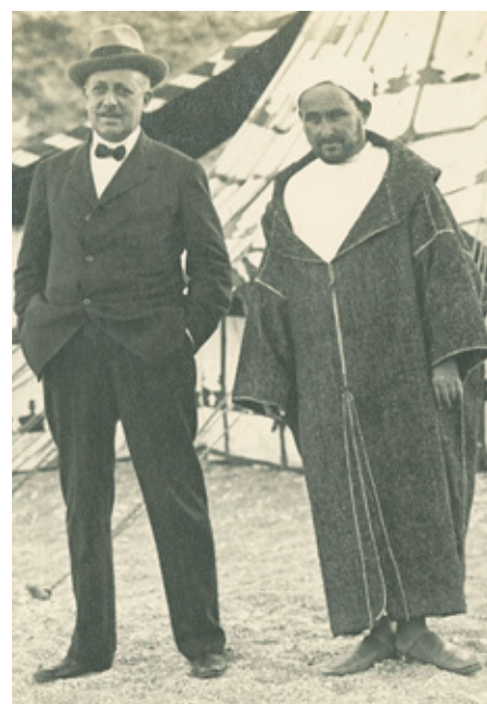
Echevarrieta Abd-El-Krim Rifeko liderrarekin batera, zeinekin Annualeko Hondamendian erorritako presoek askapena negoziatu zuen

Informazioa eta inskripzioak: www.puntabegonagetxo.eus .