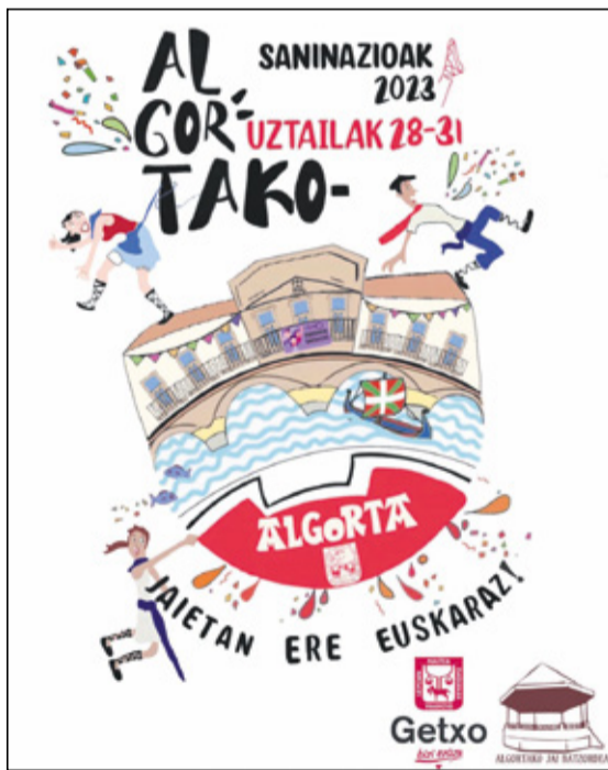
Kartel irabazlea Leize Inchaurre Puentek egin du

Gaueko bus bat ere ibiliko da uztailaren 31n, 23:00etatik 06:00etara, ibilgailu pribatua erabili behar ez izateko.