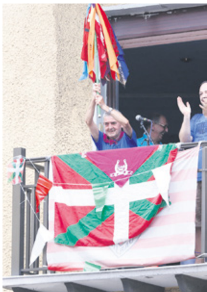
Txutxo, bizitza guztia jaietara ematen