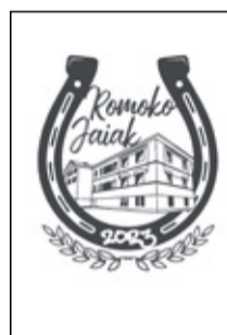
Kamisetaren eta zapiaren diseinuak: Unai Aretxabaleta Lezama