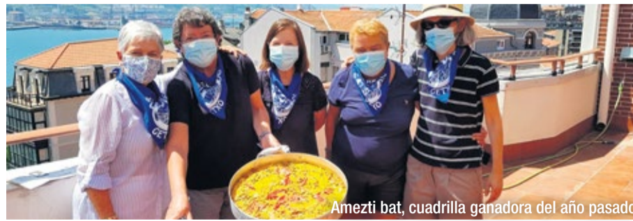
Amezti bat, cuadrilla ganadora del año pasado

Para participar hay que enviar por whatsapp (tfn. 640 506 223) una única foto de la paella con el pañuelo de este año (a la venta en los comercios de Algorta) y la cuadrilla (con su nombre). Los premios