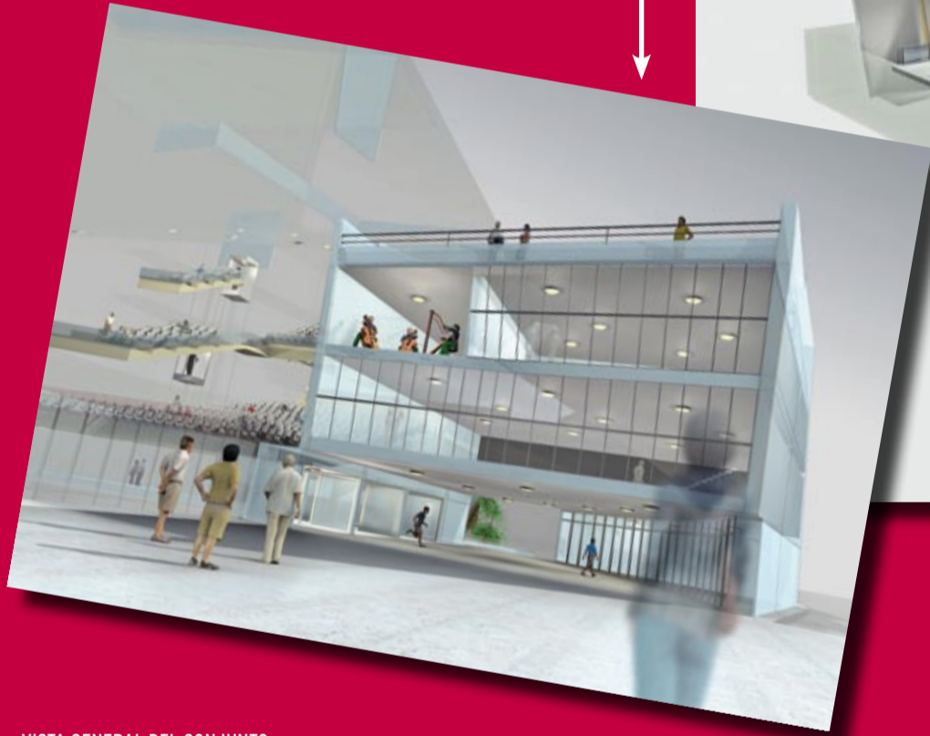
VISTA GENERAL DEL CONJUNTO (A LA DERECHA MUSIKA ESKOLA Y A LA IZQUIERDA AUDITORIO PRINCIPAL CON ESCENARIO)