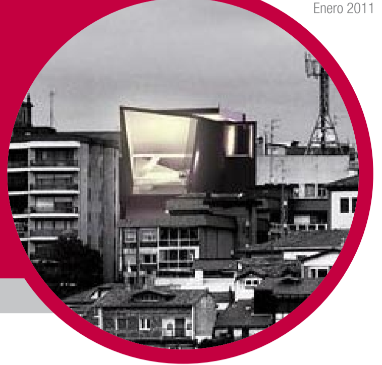
VISTA GENERAL DEL CONJUNTO (AUDITORIO PRINCIPAL CON ESCENARIO Y EN NIVELES BAJO RASANTE AUDITORIO ALTERNATIVO, AUDITORIO MUSIKA ESKOLA Y ESPACIO POLIVALENTE)

UNA VENTANA AL ABRA, ESCENARIO DE EMOCIONES ...FARO CULTURAL DE NUESTRO ENTORNO