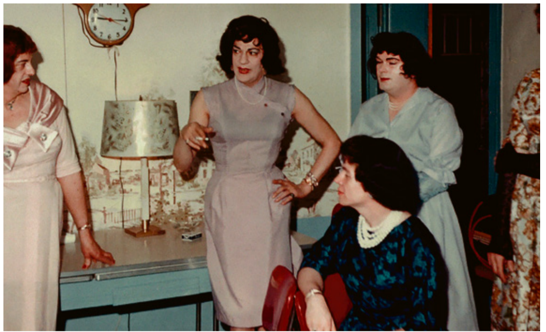
“Casa Susanna” dokumentalaren eszena

Hilak 1, osteguna: ASANBLADA Hilak 4, igandea: SMASH BROS TXAPELKETA Hilak 6, asteartea: XAKE TXAPELKETA Hilak 8, osteguna: HAURREN ESKUBIDEEN EGUNA Hilak 9, ostirala; 10, larunbata, eta 11, igandea: TXIKIFEST Hilak 14, asteazkena: JUST DANCE Hilak 15, osteguna: HANBURGESAK Hilak 16, ostirala: MOTXILA PERTSONALIZATUAK Hilak 18, igandea: IRTEERA: MUNDUKO ARROZAK Hilak 20, asteartea: IRTEERA: FIFA TXAPELKETA Hilak 23, ostirala: IRTEERA: ZINEGOAK Hilak 24, larunbata: IRTEERA: BIZKAIA ZUBIA Hilak 28, asteazkena: IRTEERA: IGERILEKUA Hilak 30, ostirala: IRTEERA: HONDARTZA