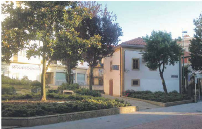
Gazte Bulegoa, Algortan

Web orri hau aldiro-aldiro elikatuko da garrantzitsutzat jotzen diren informazio eta baliabideekin, ahalik eta bilaketa espaziorik eraginkorra izan dadin. Gaur egun hurrengo informazioak eskaintzen ditu: Gazte Bulegoaren zerbitzuak, Getxoko agenda, formakuntza, gazteentzako laguntzak, Getxoko jarduerak, GazteTIC, teknologia berrien kudeaketarako informazio eta baliabideak, Wanted edo lonjak bezalako gazte-proiektuak, edo bolondres lana. Webgunearen atal horren helbidea betikoa da: www.getxo.eus/gazteria