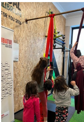
ZIRKO TXIKI GLOBAL EQUILIBRIUM + GENERALI SEGUROS ALGORTA