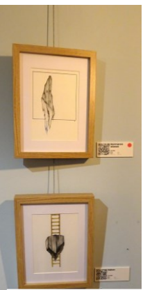
Erakusketa - Exposición Eneko Egaña LA BIRROTXA TABERNA