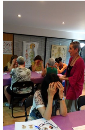
AUTOMASAJE-A ESTIMUA ESPACIO DE BIENESTAR