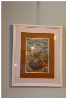
Erakusketa - Exposición Ramón Mayoral LA BIRROTXA TABEERNA