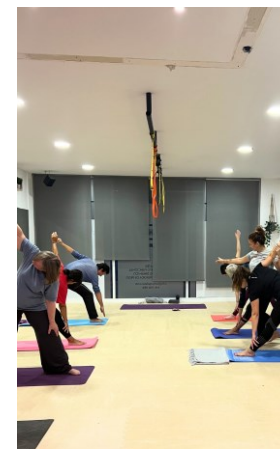
YOGA KEMEN PILATES