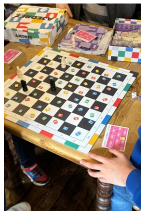
XAKEA - AJEDREZ DAMA GAZTEA