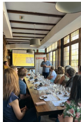
Bidezko merkataritzaren dastaketa Cata de comercio justo ASADOR BORDA