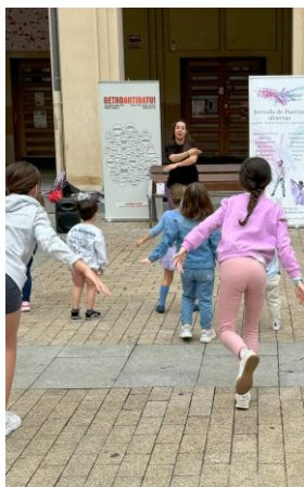
Dantza-Baile VIVÓ LA DANSE STUDIO