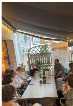
Elkarrizketa ingelesez Conversación en inglés URBAN HUB LANGUAGE SCHOOL + ALVARITOS BAR