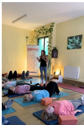
Arnasketa-tailerra Taller de respiración ALGORTA YOGA SHALA