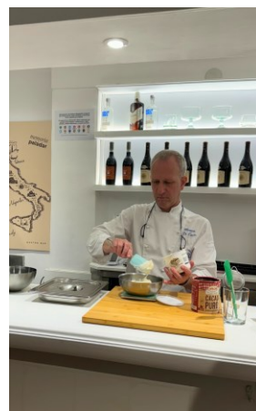
Nola egin tiramisú bat Cómo elaborar un Tiramisú MEMORIA DEL PALADAR (MASSIMO DI CENCIO)