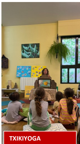
TXIKIYOGA ALGORTA YOGA SHALA