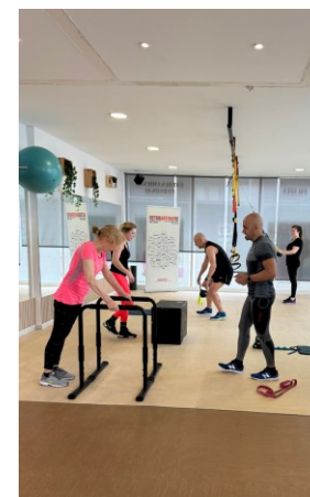
Entrenamendu funtzionala Entrenamiento funcional KEMEN PILATES