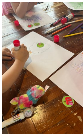
Adimen emozionala Inteligencia emocional CEREBRITO PÉREZ + ANAKIDS