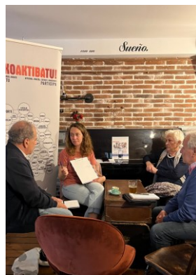
Frantsesezko elkarrizketa Conversación en francés BONJOURGETXO! ACADEMIA DE FRANCÉS