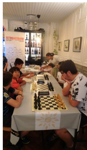
XAKEA - AJEDREZ DAMA GAZTEA + GUSTOKO