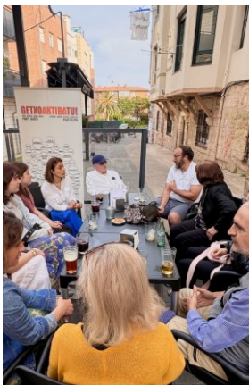
Elkarrizketa ingelesez Conversación en inglés URBAN HUB LANGUAGE SCHOOL + LA BIRROTXA TABERNA