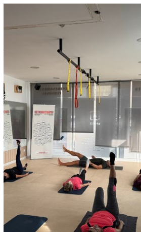
PILATES KEMEN PILATES