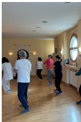
CHIKUNG + TAICHI ESPACIO ZEN CONTEMPORÁNEO