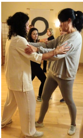
CHIKUNG + TAICHI ESPACIO ZEN CONTEMPORÁNEO