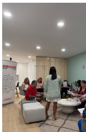
Ezagutu zure estres-maila Conoce tu nivel de estrés SUPERVISONI