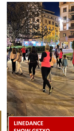
LINEDANCE SHOW GETXO