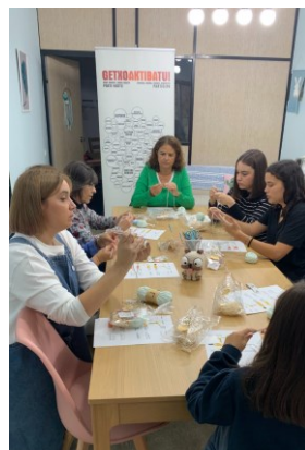
Lanak eta eskulanak Labores y manualidades MAIDER CROCHET TOKI