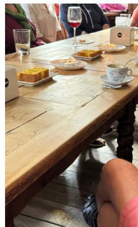
Death café GETXO ZUREKIN + PIPERS