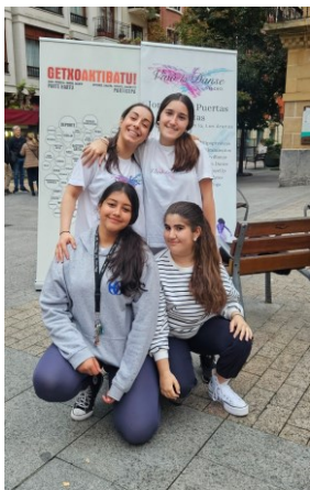
Danceup VIVÓ LA DANSE STUDIO