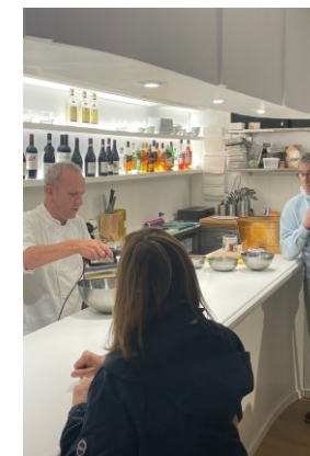
Nola egin tiramisú bat Cómo elaborar un Tiramisú MEMORIA DEL PALADAR