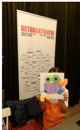
Lanak eta eskulanak Labores y manualidades ANAKIDS + CEREBRITO PÉREZ