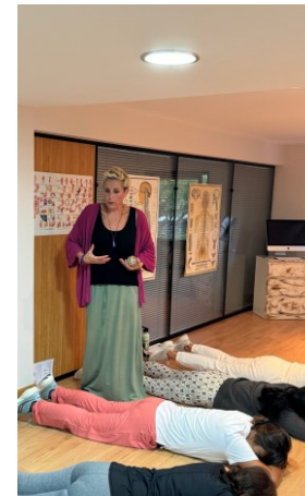
Bizkarreko mina kentzen du Elimina dolores de espalda ESTIMUA ESPACIO DE BIENESTAR