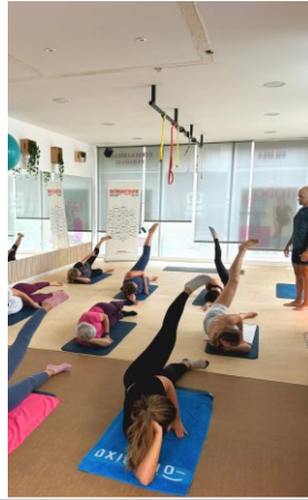
PILATES KEMEN PILATES