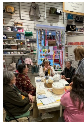
Lanak eta eskulanak Labores y manualidades BLONDA II