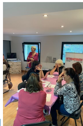
AUTOMASAJE-A ESTIMUA ESPACIO DE BIENESTAR