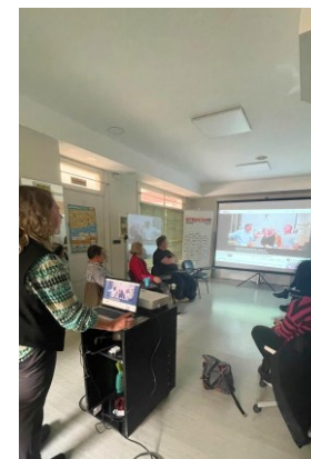
Ingelesezko elkarrizketa Conversación en inglés GETXO LANGUAGE SERVICES