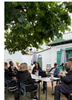
Ingeleseko elkarrizketa Conversación en inglés GETXO LANGUAGE SERVICES + RTE PABLO URZAY