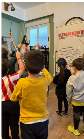
Pentsamendu kritikoa "Magia Eskola" Del pensamiento crítico "Escuela de Magia" CEREBRITO PÉREZ + ANAKIDS