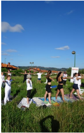
YOGA ASOCIACIÓN ANAHATA