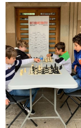
XAKEA - AJEDREZ DAMA GAZTEA