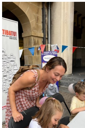
Lanak eta eskulanak Labores y manualidades BONJOURGETXO! ACADEMIA DE FRANCÉS