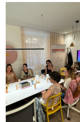
Eskulanak Manualidades OBJETO