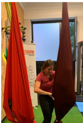
ZIRKO TXIKI GLOBAL EQUILIBRIUM + GENERALI SEGUROS ALGORTA