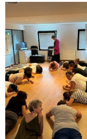
Bizkarreko mina kentzen du Elimina dolores de espalda ESTIMUA ESPACIO DE BIENESTAR