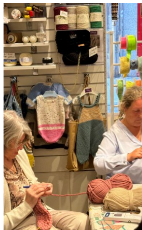
Lanak eta eskulanak Labores y manualidades BLONDA II