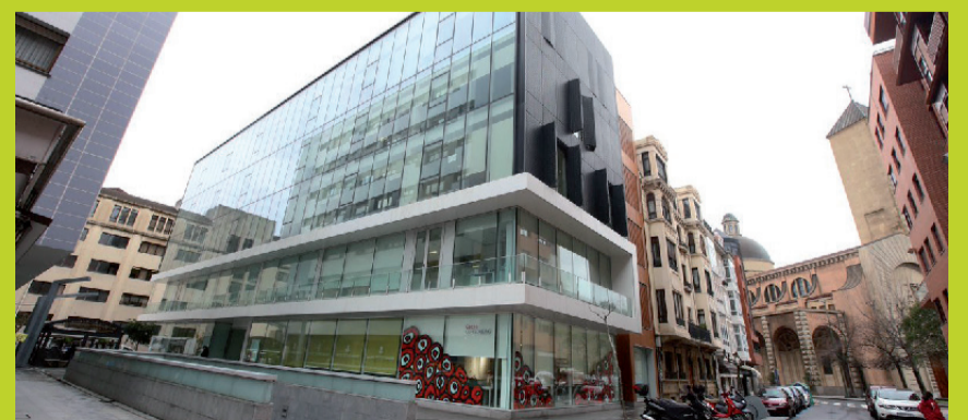
MUGIKORTASUN JASANGARRIARI BURUZKO JARDUNALDIA. Irailaren 21ean, 11:00etan. Getxolan. Ogoño kalea, 1. Areta.

Jardunaldietara joatea librea izango da.