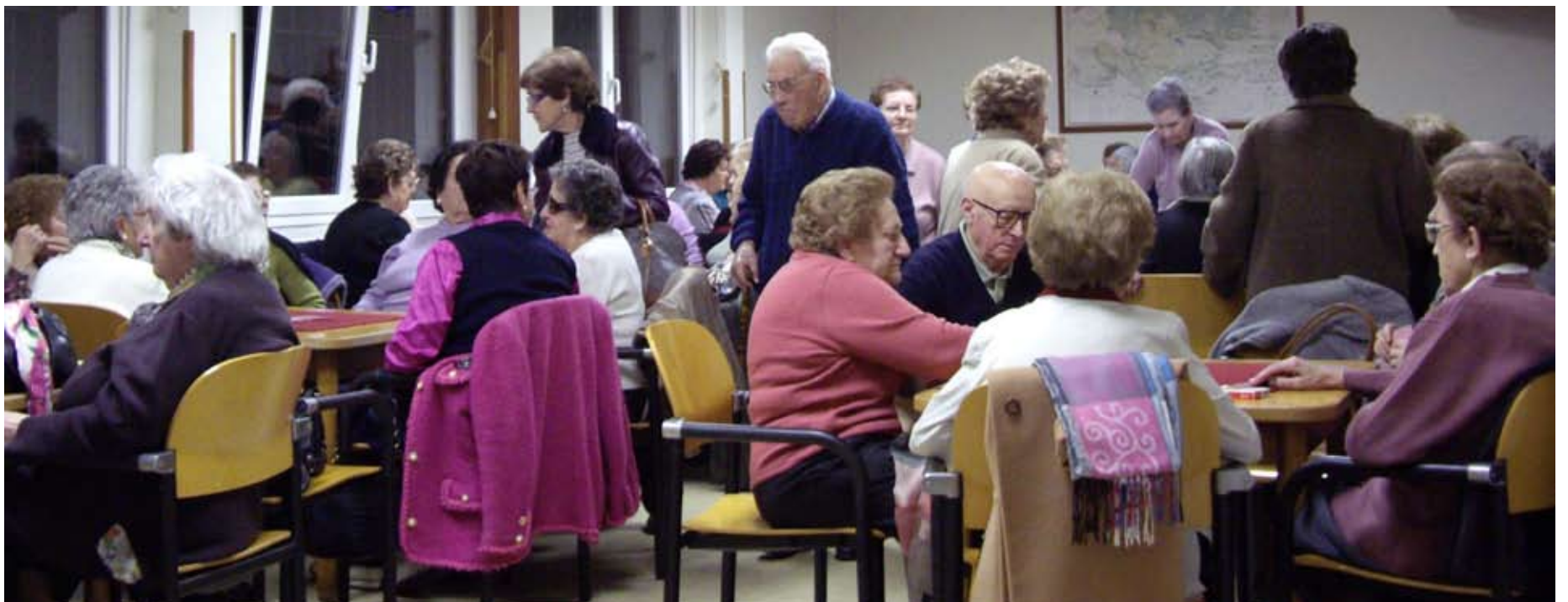
Romoko Nagusien Etxea, 2012

2012ko ekitaldiko kontuen likidazioan, ekitaldia amaitu eta ia-ia hilabete geroago onetsitakoan, ikus daitekeen ekonomia eta finantza agertokiari esker, 2013. urteari nolabaiteko lasaitasunez heldu ahal zaio. Getxo gai izan da zerbitzuen prestazio mailari eusteko (gizarte-politikak, kalitateari eta ekonomia-sustapenari lotutako oinarrizko zerbitzuak) eta abian dauden proiektu estrategikoen finantzaketa bermatzeko. Hala ere, ezinbestekoa da zorrotasun ekonomikoa eta gehiengo zuhurtzia izatea.