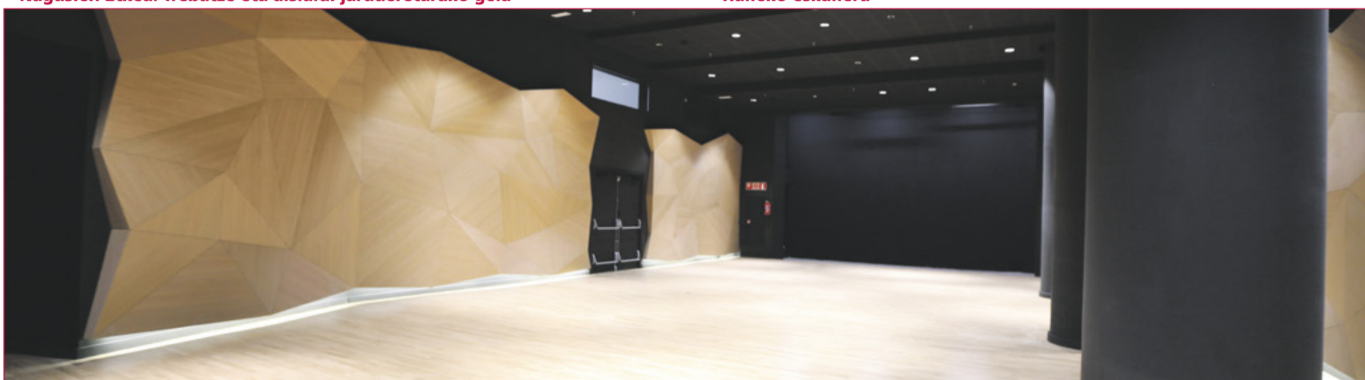
Erabilera anitzeko ekitaldi-aretoa