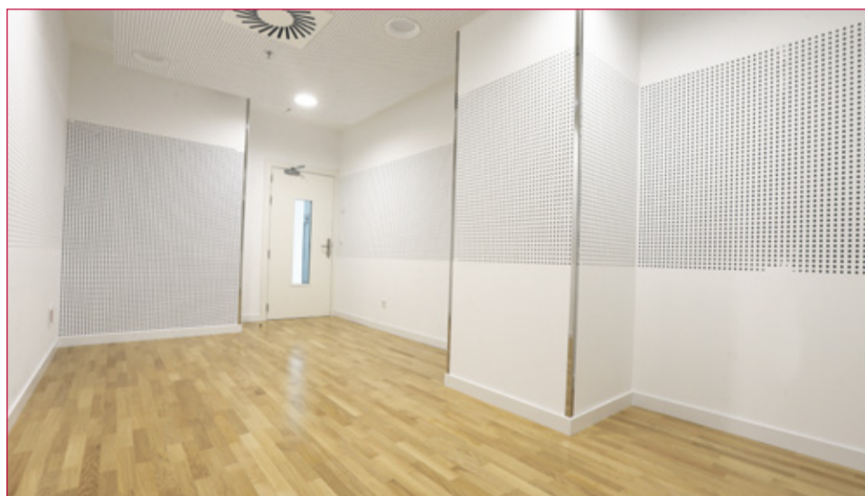
Musika taldeen entseguetarako areto bat