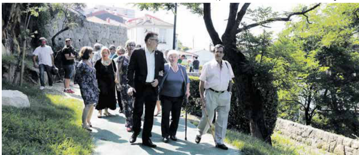
Genaratxuko pasealekua lan berriekin osatuko da