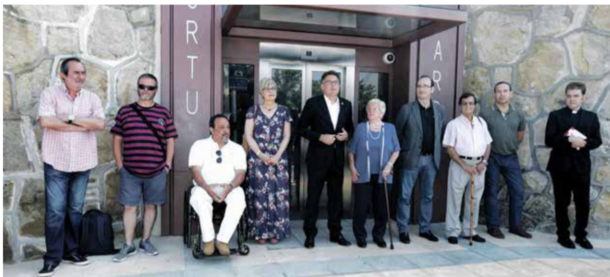
Alkatea, politikari eta auzotarren ordezkariak inaugurazioan

Udala irisgarritasuna hobetzeko lanean ari da. Izan ere, Portuko igogailua Ereagan, Villamonten, Aiboan eta Alangon daudenei (Alangoren kasuan laugarren igogailua egiten ari da) eta Salsidu eta Bidezabalgo eskaile-ra mekanikoei gehitu behar zaie.