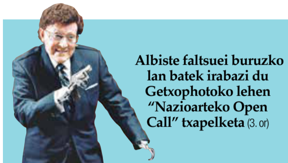
Albiste faltsuei buruzko lan batek irabazi du Getxophotoko lehen "Nazioarteko Open Call" txapelketa (3. or)

Santa Ana jaietan. Ostiralek, uztailak 20, igandera arte, uztailak 22. Ostiralean, 19:00etan, txupinazoa eta magia erakustaldia (ikusitako ekitaldiak 2. or.-ko agendan).