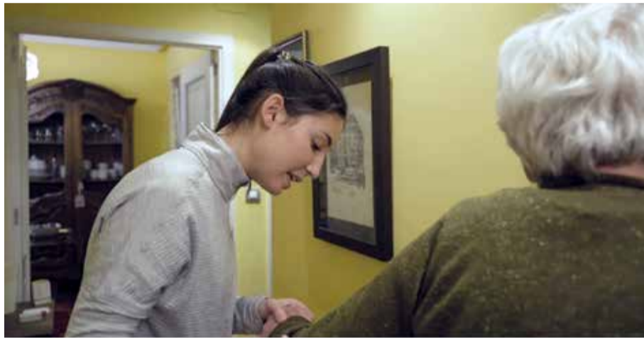
Ubikarek menpeko pertsonak etxean zaintzeko zerbitzu integrala eskaintzen du