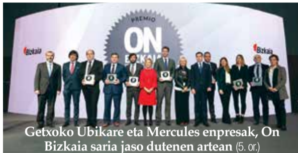
Getxoko Ubikare eta Mercales enpresak, On Bizkaia saria jaso dutenen artean (5. or.)