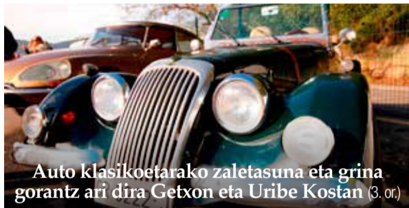
Auto Klasikoetarako zaletasuna eta grina gorantz ari dira Getxon eta Uribe Kostan (3. or.)