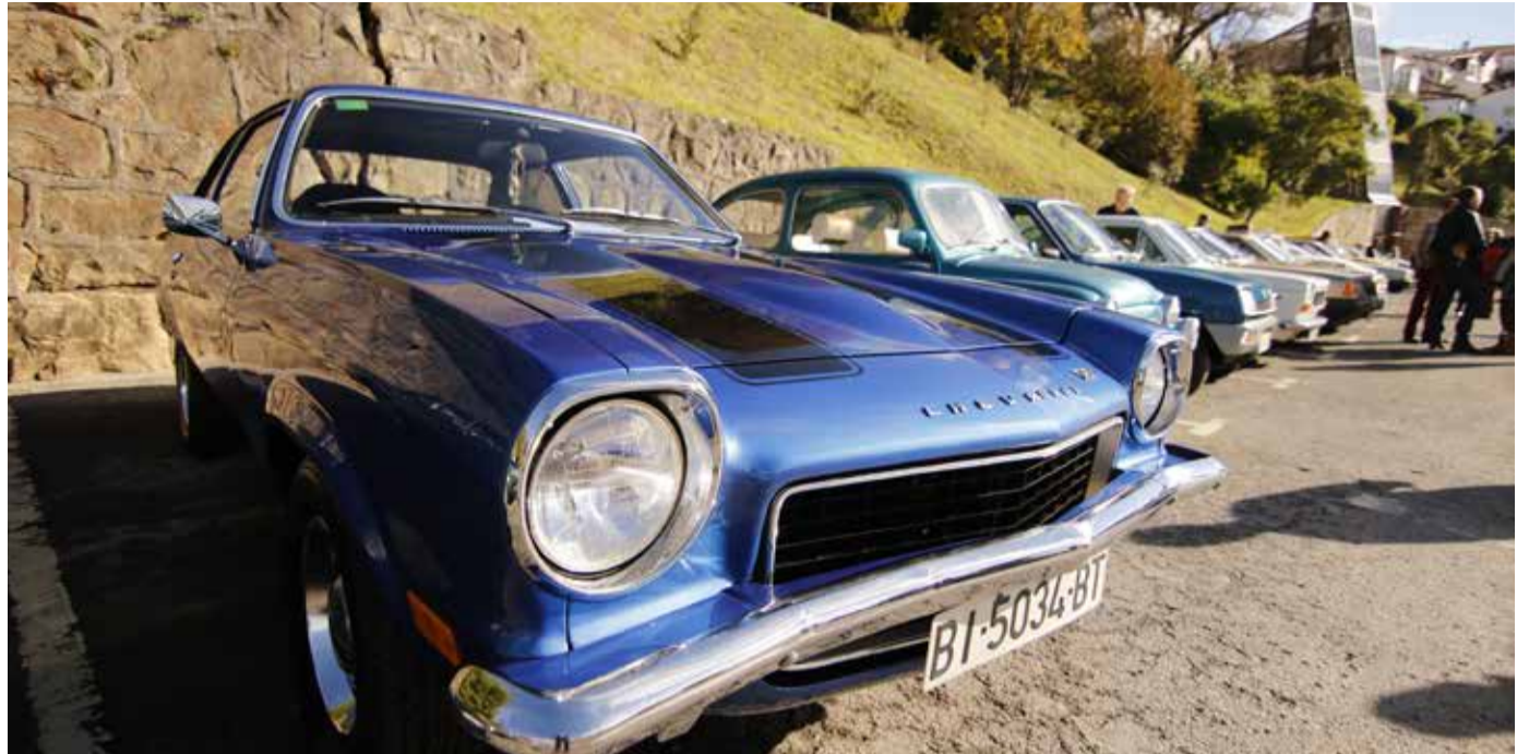
Klasikoen elkarretaratzea iragan azaroan, Portu Zaharrean