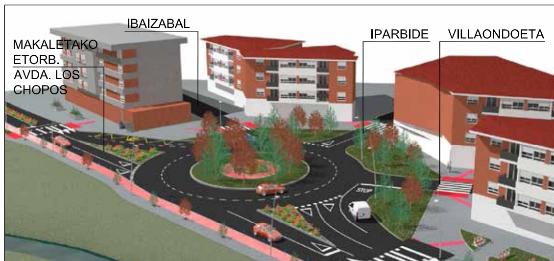
V-etan sartu eta irteteko biribilgunea